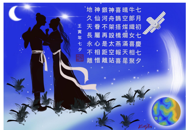
頌中國情人節“七夕”(詩與圖:程學敏)